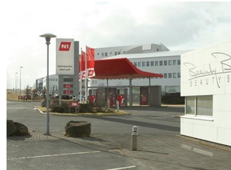
Hæðasmári Tekin í notkun 2001