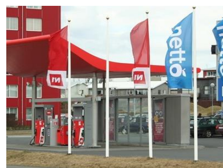
Salavegur (selt án merkinga) Tekin í notkun 2002