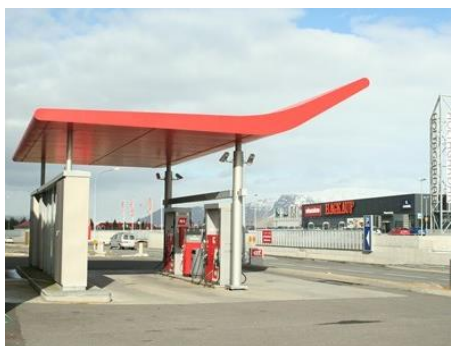
Holtagarðar (selt án merkinga) Tekin í notkun 2003