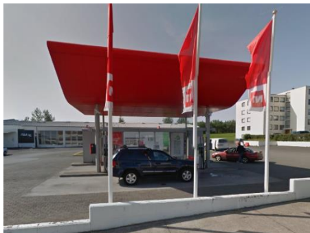
Fellsmúli Tekin í notkun 2002