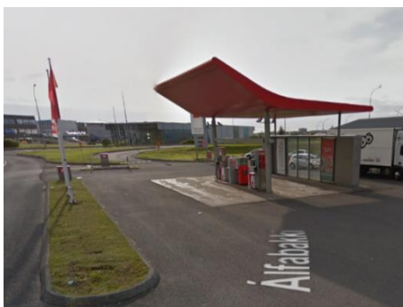
Mjódd (Stekkjarkakki) Tekin í notkun 2004