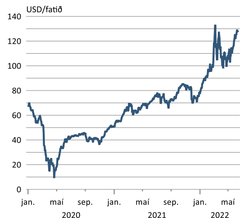
Heimsmarkaðsverð á olíu (Brent)